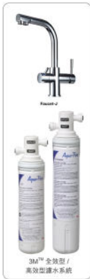
3M™ 全效型 / 高效型濾水系統